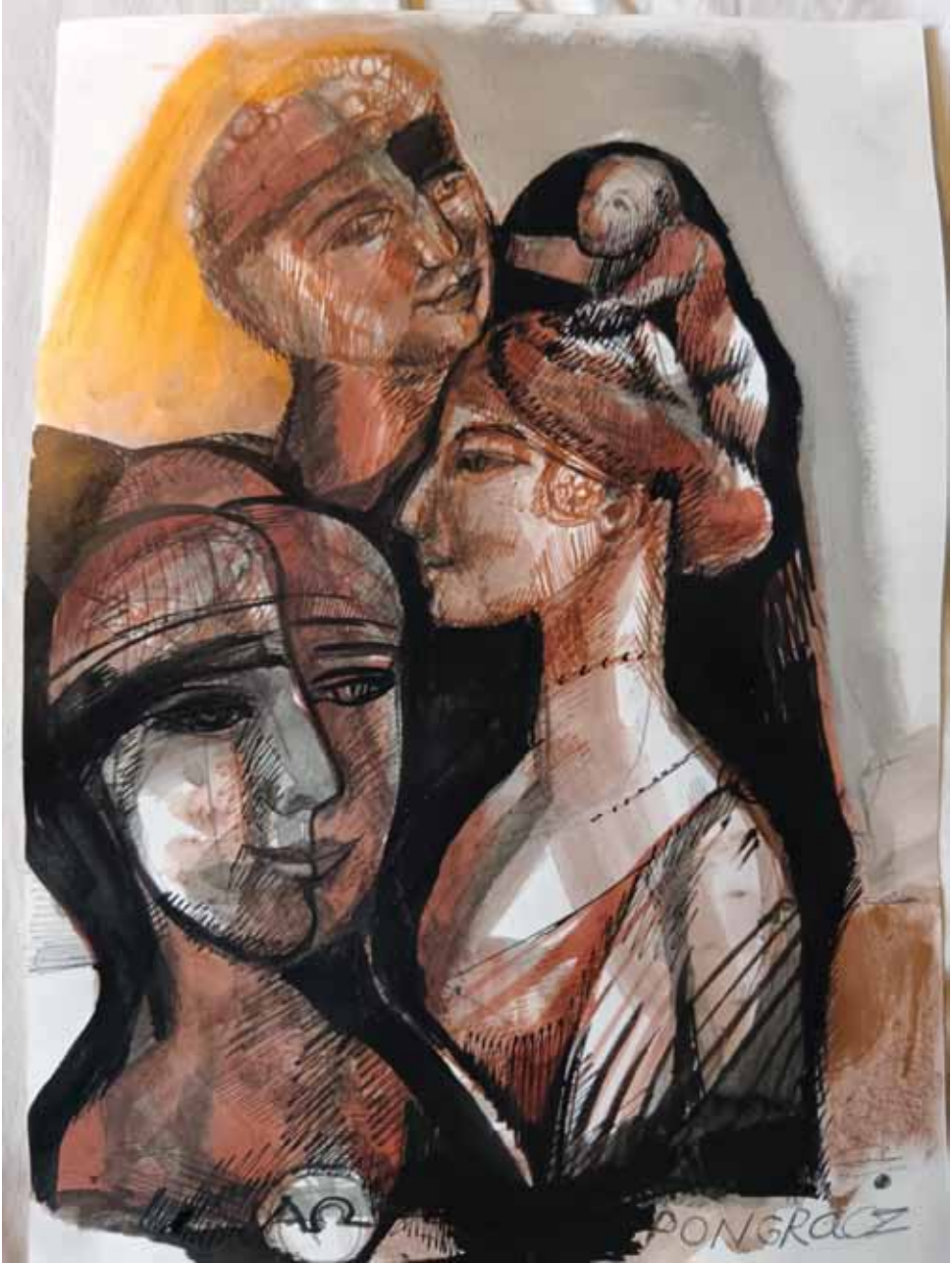
Pongrácz Éva rajza