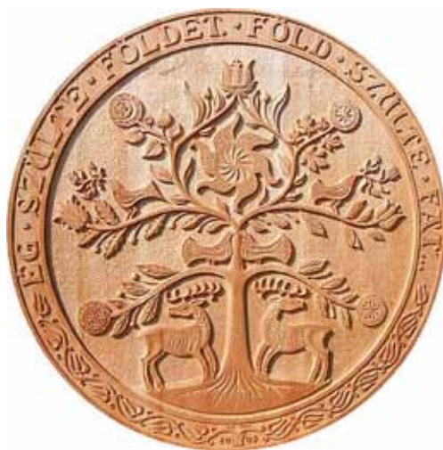
Vass Tamás fafaragó életfája

A címlapon a pécsi Jókai tér az 1950-es években