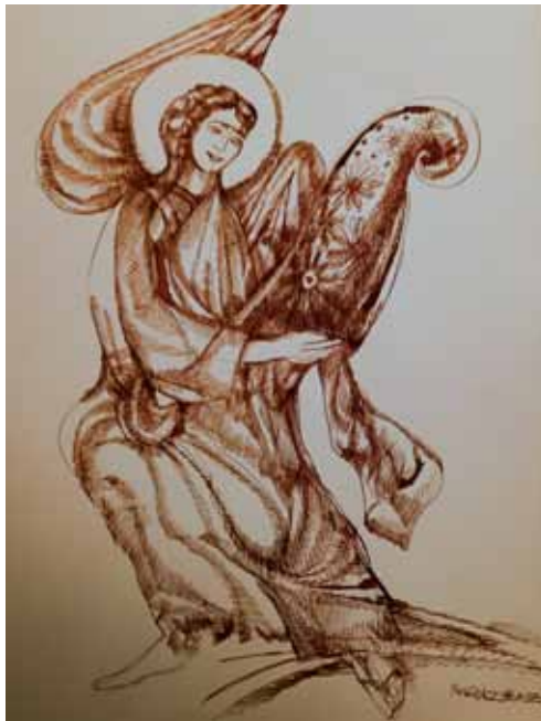
Pongrácz Éva rajza

Gyászos az éj, sötét, a baglyok huhognak, magos hegyeinkben a folyók megállnak. Intetet az égből Emese és Árpád, Csaba hadserege szövögeti álmát. Lógó fejjel ballag a jó csodaszarvas. Magyarok Istene, mért vagy oly hatalmas?