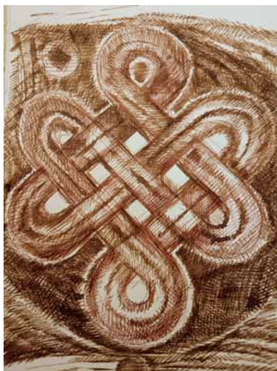
Pongrácz Éva rajza

2017. április 16-án, 17-én, 19-én és 20-án