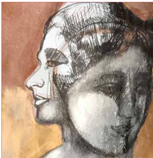
Pongrácz Éva rajza

Rövid, de talán lényegi áttekintésünkből kirajzolódik, hogyan válik a tudás egyre szélesebb rétegek számára hozzáférhetővé, a valamikori nagyarányú analfabetizmus miként változik napjainkra, amikor a tudás szinte mindenki számára elérhető lehetőség — és látjuk ebben az egész folyamatban a segítő szakembert, a könyvtárost.